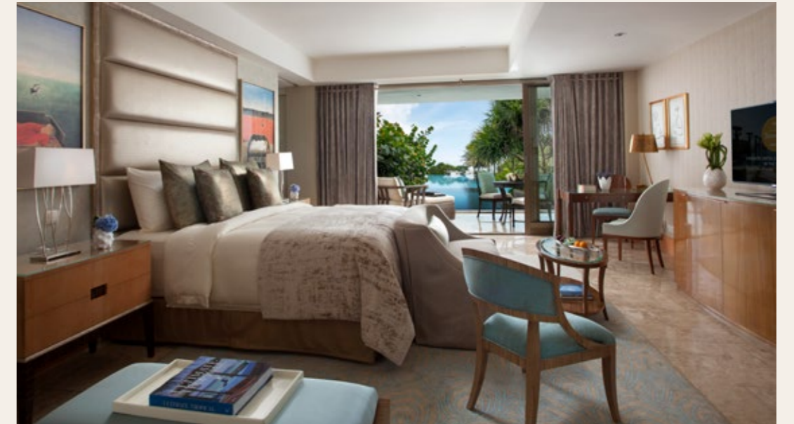
마퀴스 스위트 (The Marquess Suite) 2베드룸 스위트에서 즐기는 파노라마 오션뷰와 세련된 프라이버시.