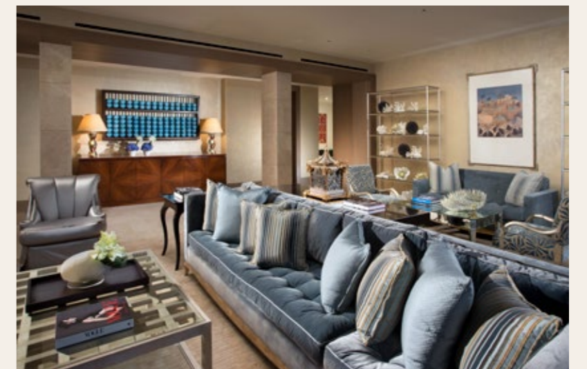
总统别墅 带私人泳池和专属安保的三卧室独立庄园。